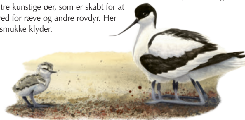
Klyde med unger

I Nørreballe Nor ligger tre kunstige øer, som er skabt for at ynglefugle kan være i fred for ræve og andre rovdyr. Her yngler blandt andet de smukke klyder.